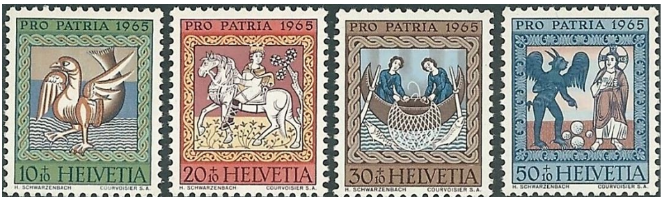
Coq à queue de poisson

Le plafond de l'église réformée Saint-Martin de Zillis dans le canton des Grisons constitue un des témoins les plus importants qui nous reste de l'époque romane. Il se compose de 153 panneaux carrés en bois de sapin plâtré et peint. Ils sont disposés au plafond de façon à représenter une carte symbolique du monde. Nous trouvons ici l'esprit de l'ingénu, toute sa verve, sa naïveté et sa facilité étrange à tout admettre.