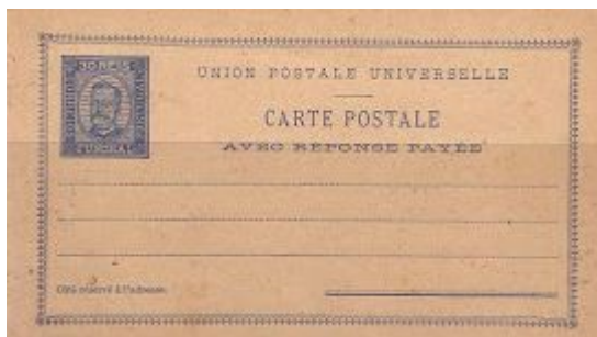
Entier postal de Funchal

Des émissions particulières, valable sur l'ensemble du territoire portugais, ont repris en 1980, date de leurs autonomies postale.