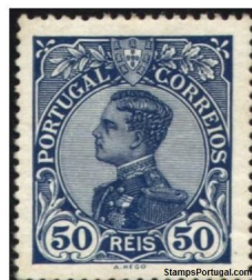
Timbre de 1910, Emmanuel II