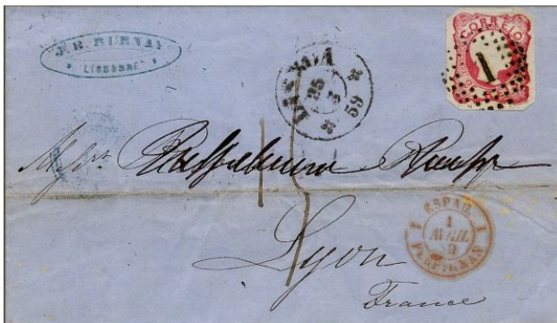
Lettre de Lisboa (Lisbonne) à Lyon (France) du 25 mars 1859

Les premiers timbres-poste portugais à l'effigie de Dona Maria II et imprimée en relief ont des valeurs faciale de 5, 25, 50 et 100 Reis.