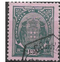
Compagnie du Mozambique