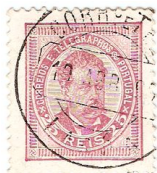
Timbre de 1882, effigie de Louis 1 er .

Partie le 13 mai de l'île de Madère, ce courrier est arrivé en France à Calais sept jours plus tard.