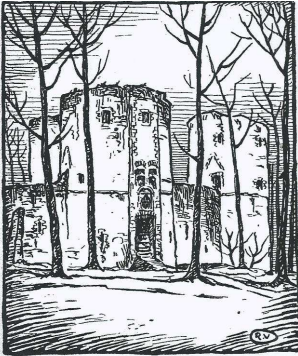
— LA FORTERESSE DE BEERSEL AVANT SA RESTAURATION.